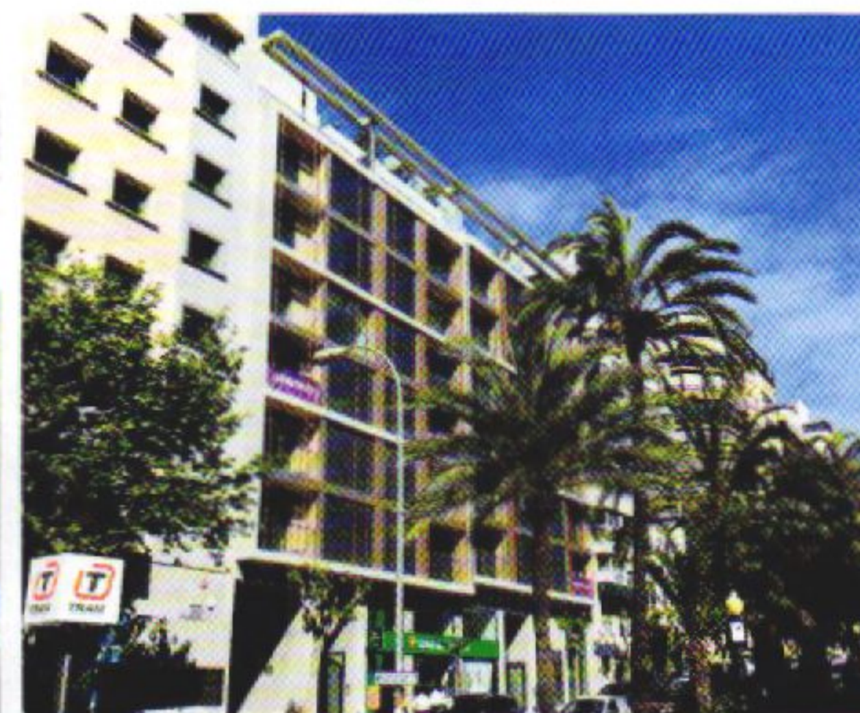
Las viviendas integran la filosofía puredesign que apuesta por la arquitectura y el diseño.