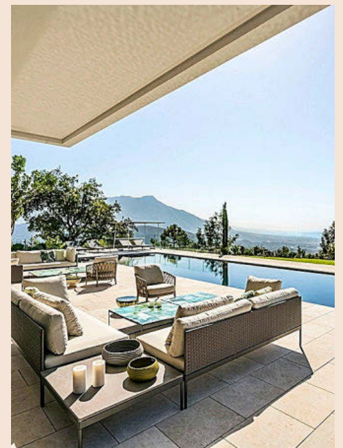
Vistas de la piscina desde una de las terrazas de esta vivienda, la más exclusiva de La Zagaleta.

En una de las mejores parcelas del resort , y con preciosas vistas sobre Marbella, se vende la que está considerada la casa más cara en venta en estos momentos en la Costa del Sol. Se trata de una mansión que comercializa la inmobiliaria Barnes,