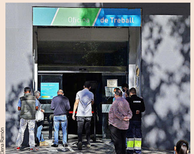
Colas frente a una oficina de trabajo de la Generalitat.