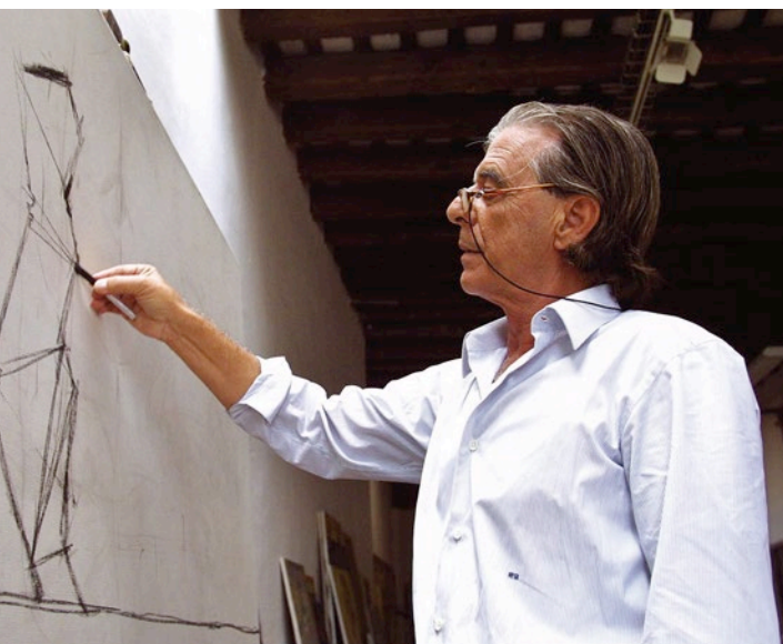
RICARDO BOFILL TALLER DE ARQUITECTURA